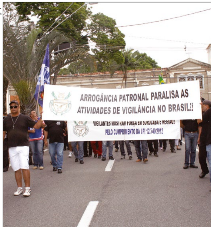
Passeata no centro de Sorocaba chamou a atenção para a reivindicação

Cerca de 500 vigilantes de Sorocaba realizaram, no último dia 1º, um protesto nas ruas centrais de Sorocaba para exigir que as empresas cumpram uma lei assinada pela presidenta Dilma Rousseff em dezembro (12.740/2012), que garante 30% de adicional periculosidade nos salários desses profissionais.