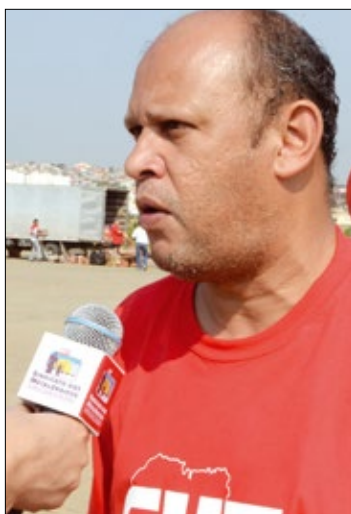
Terto: conquista dos trabalhadores

O governo estima que a renúncia fiscal provocada por essa medida será de R$