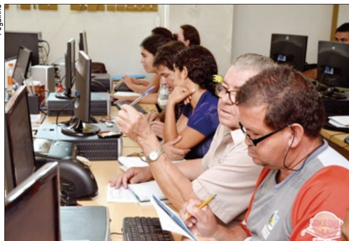
Na sede de Sorocaba o curso gratuito de informática é oferecido há 18 anos