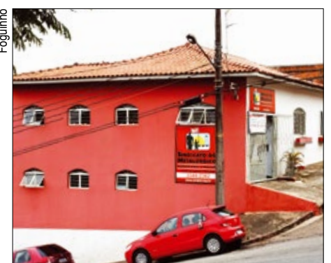
O Sindicato em Piedade fica na vila Olinda

As aulas são ministradas por professores da AHCX, em parceria com o Sindicato dos Metalúrgicos e com suporte da RH Treinare, que ministra cursos na sede de Sorocaba.