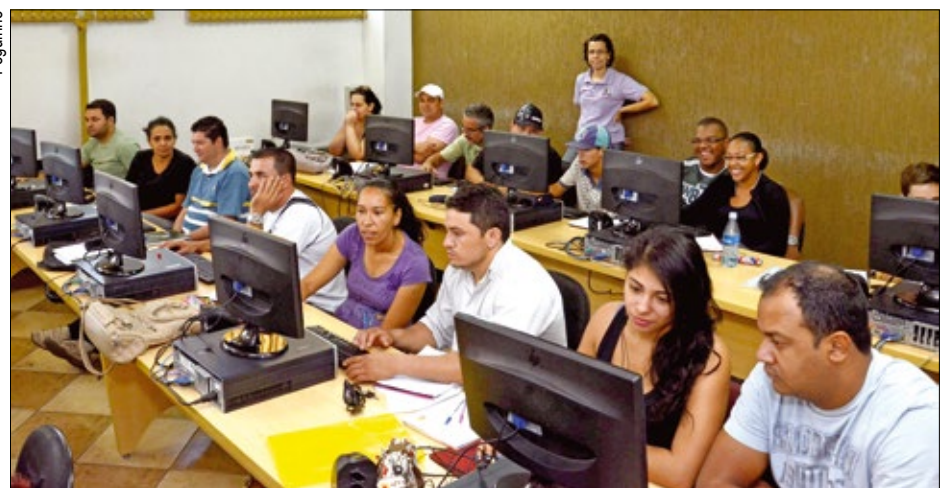
Sindicato oferece 150 vagas para o curso que terá início em fevereiro e dura cerca de 3 meses

Começou na segunda-feira, dia 21, e segue até a próxima quinta-feira, dia 31, o período de inscrições para o tradicional curso gratuito de Informática, oferecido pelo Sindicato dos Metalúrgicos de Sorocaba e Região. As inscrições podem ser feitas de segunda à sexta-feira das 8h às 12h e das 14h às 19h.