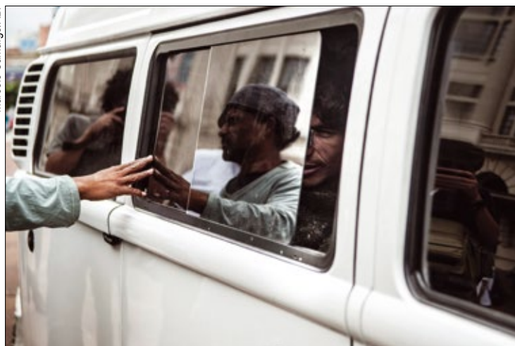
Usuários de crack, no Centro de São Paulo, são levados a instituições conveniadas