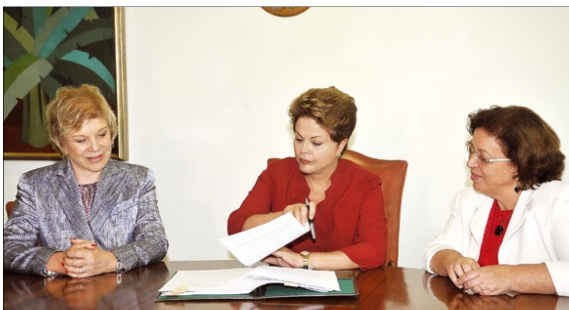
A ministra da Cultura, Marta Suplicy, a presidenta Dilma Rousseff e a ministra da Secretaria de Relações Institucionais, Ideli Salvatti, durante sanção da Lei do Vale-Cultura, no Palácio do Planalto

A presidenta Dilma Rousseff (PT) sancionou, no final de dezembro, a lei que institui o Vale-Cultura. O vale, de R$ 50 mensais, irá beneficiar trabalhadores da iniciativa privada que ganham até cinco salários mínimos (R$ 3.390, considerando o valor a partir de 2013).